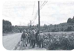
7月9日七曲紫陽花ロード