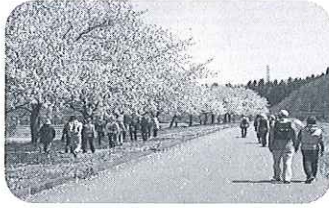
4月23日桜堤～岩見川沿い