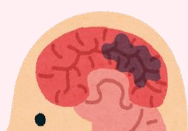
血管が詰まって一部の細胞が死ぬ(脳血管性認知症)