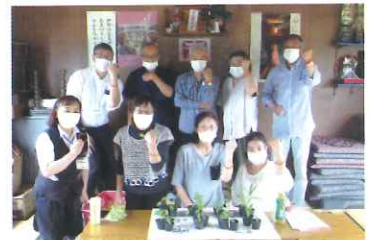
(上：山根サロン、 下：榊表サロンにて 実施しました)

認知症サポーターは認知症を正しく理解し、偏見を持たず認知症の人やその家族の応援者です。受講者5人以上で受講でき、料金はかかりません。申込は河辺地域包括支援センターまで