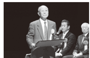
太平地区 利部周市氏