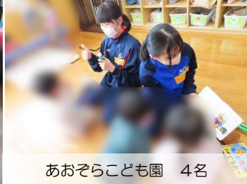
あおぞらこども園 4名