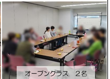
オープンクラス 2名