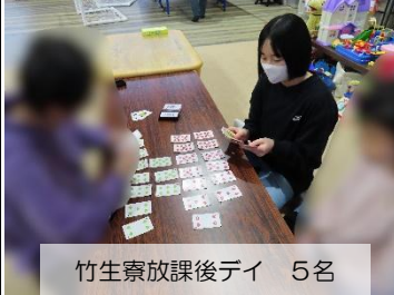
竹生寮放課後デイ 5名