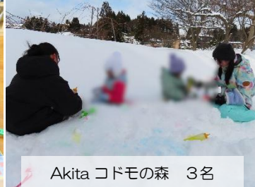
Akita コドモの森 3名