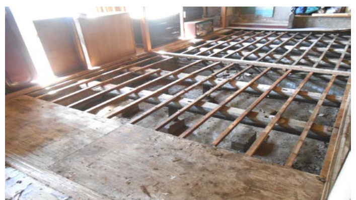
床下を十分に乾燥 床張、修繕は大工さんなどの専門家へ依頼。