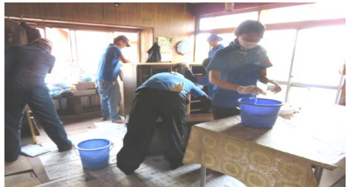
水に浸かった家財と床板の消毒 一つ一つ丁寧に消毒液で水拭きしました。