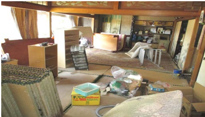
床上浸水した部屋 畳、じゅうたんは水を吸っており、処分することにしました。

秋田市ボランティアセンター（秋田市社会福祉協議会内）では、被害状況の把握とニーズ調査を行い、ボランティアの受入れを行いました。家屋の掃除・消毒や家具・畳等の運び出しなどを中心に63件の依頼に対し延べ300人のボランティアを送り出しました。（8月27日時点）現在、少しずつ家屋の復旧が進んできている状況ですが、被災した箇所衛生面が気になる場所です。カビが生えたり、異臭がしたりと新たな問題が発生しております。秋田市ボランティアセンターでは、今後も情報収集を行い、被災者に寄り添った活動を進めてまいります。