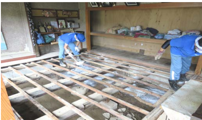
床下に流れ込み根太についた泥の除去と乾燥作業 時間が経過してから被害に気付くことが多い。