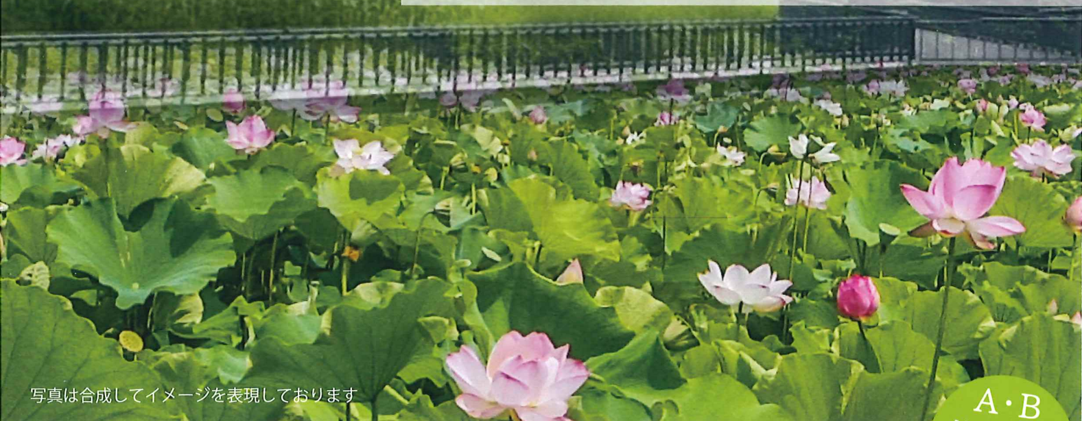
写真は合成してイメージを表現しております